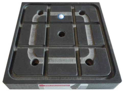
SSG-Sauger mit Ventil