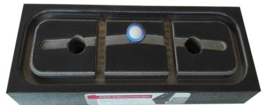
SSG-Sauger schmal mit Ventil

SSG-Vakuumsauger – da stimmt der Preis und die Qualität! Wir freuen uns auf ihre Anfrage