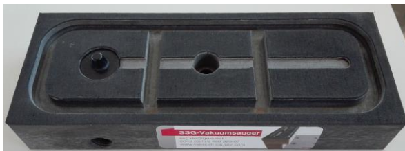
SSG-Sauger schmal mit Ventil