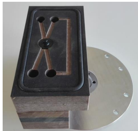
SSG-Sauger schmal 74

SSG-Vakuumsauger – da stimmt der Preis und die Qualität