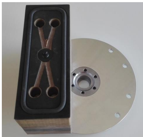
SSG-Sauger schmal 54mm

Die SSG-Vakuumsauger bestehen aus Grundplatte, Verbindungsstück und Sauger. (Saugerhöhe somit variabel bis 100mm) Dies hat den Vorteil, dass bei einem Defekt nur noch die Dichtungsschur oder der Sauger oben ersetzt werden muss – der Rest bleibt bestehen.