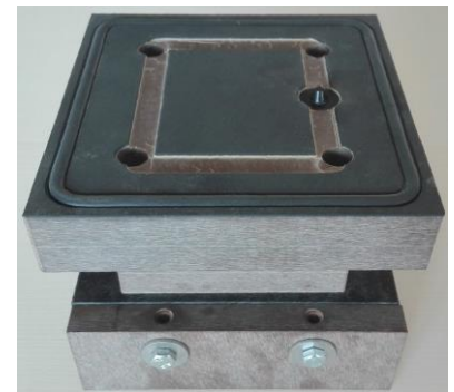
SSG-Sauger H110 Neu