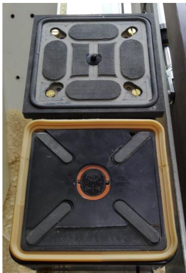
Vorne Originalsauger Hinten repariert