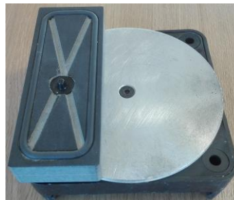
Sauger schmal repariert