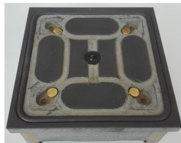
SSG-Sauger H50 Neu