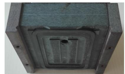
SSG-Sauger Ansicht unten

Auf diesem Flyer sehen sie nur eine kleine Auswahl der SSG-Sauger