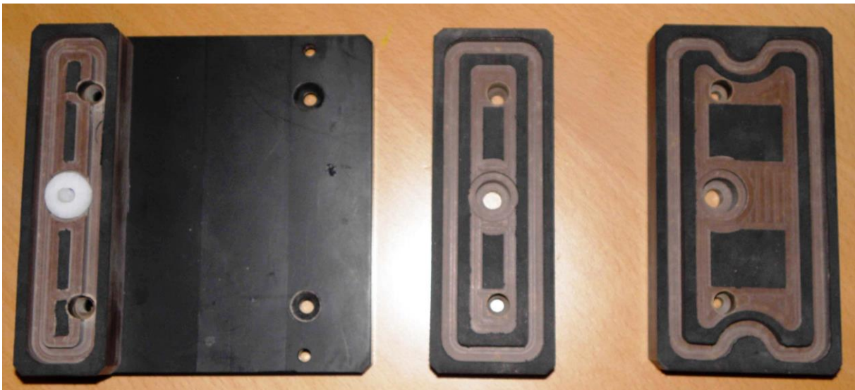
Diese SSG-Vakuum-Sauger wurden für eine Busellato hergestellt (Kundenbilder)

Mit dem Vakuum verbindet sich die körnige Gummioberfläche mit dem jeweiligen Material. Dadurch erhöht sich der Reibungswiderstand zwischen dem Werkstück und dem Vakuumsauger. Auch kleine Werkstücke können somit problemlos gespannt und rundum bearbeitet werden.