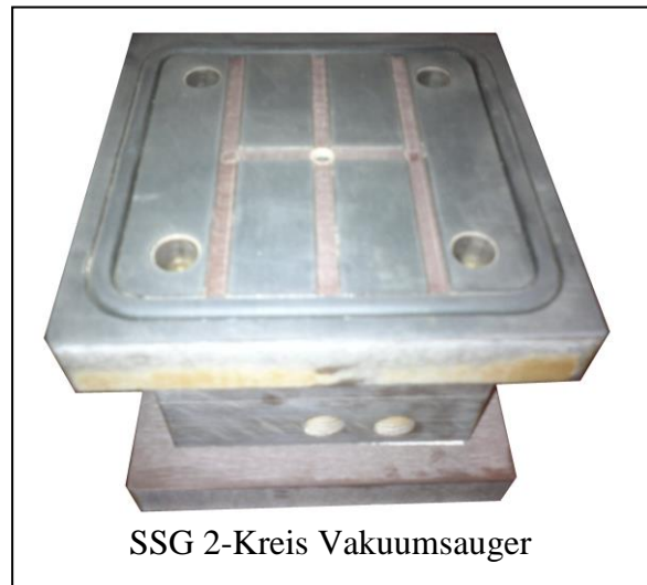
SSG 2-Kreis Vakuumsauger

Die SSG-2-Kreis-Vakuumsauger sind 3-teilig. Die Saugerhöhe und die Saugermasse sind variabel, je nach Maschinentyp. Bei einem Defekt kann einfach der Sauger oben ersetzt werden.