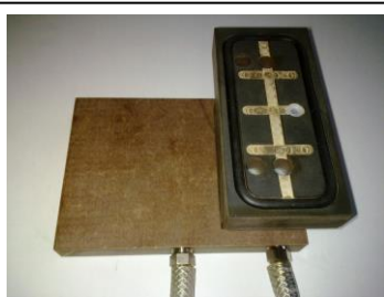
SSG 2-Kreis VS schmal