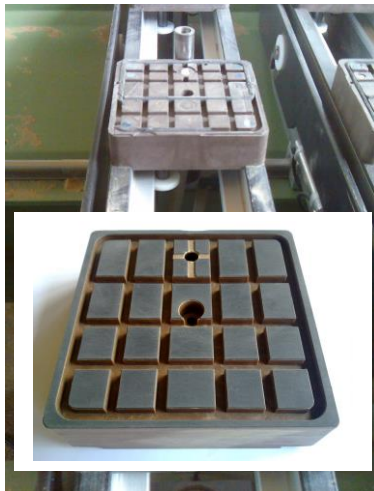
Hinten alter Sauger Vorne SSG-Sauger

Mit grossem Erfolg produzieren wir die SUPER-GRIP Reibplatten für die Herstellung von Vakuumsauger für CNC-Maschinen.