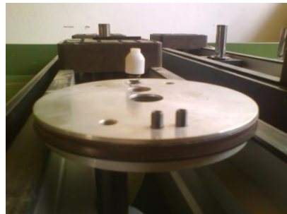
Anschluss Typ 1